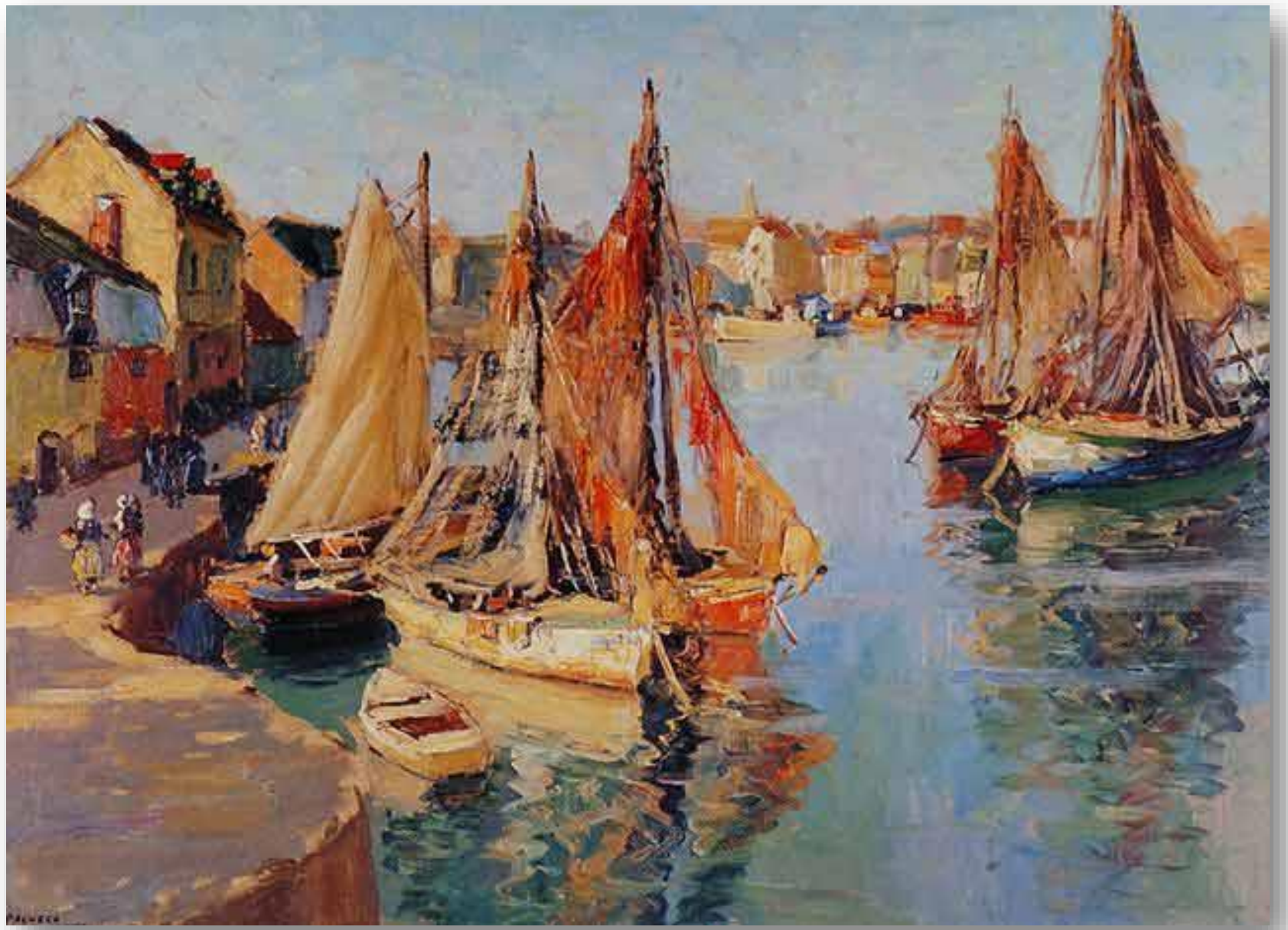
Astillero - Arturo Pacheco Altamirano