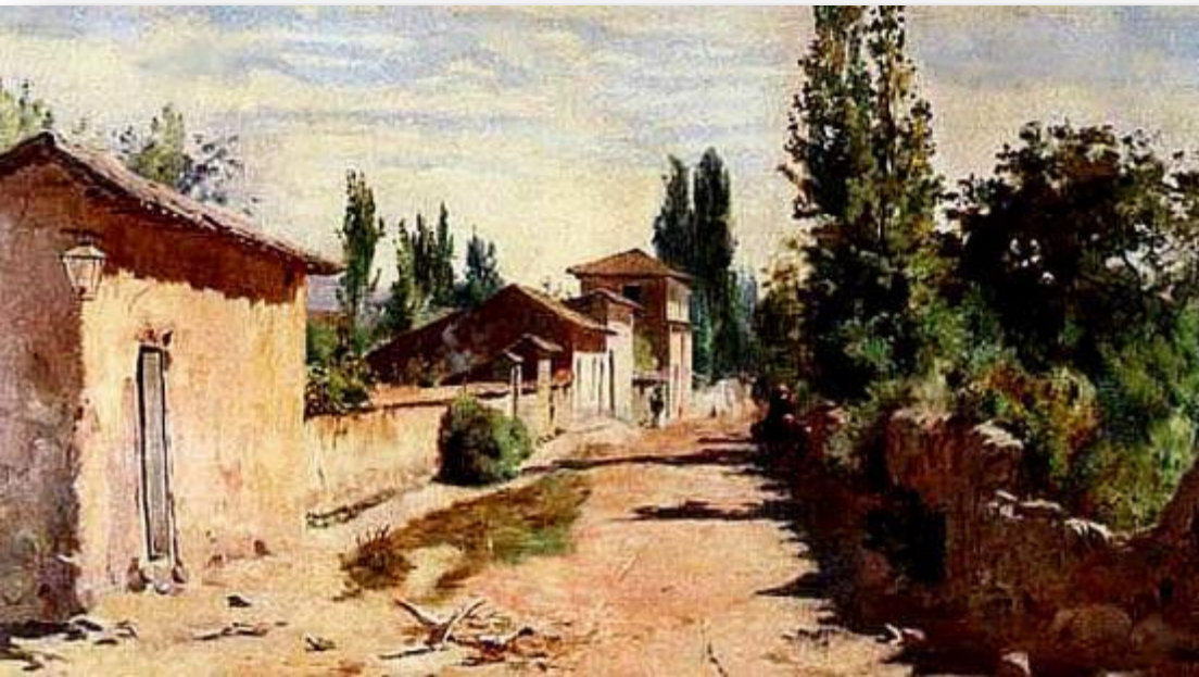
Pintura en el campo chileno – Alberto Valenzuela Llanos