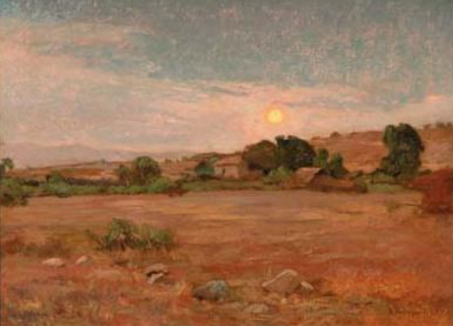
Puesta de sol - Alberto Valenzuela Llanos