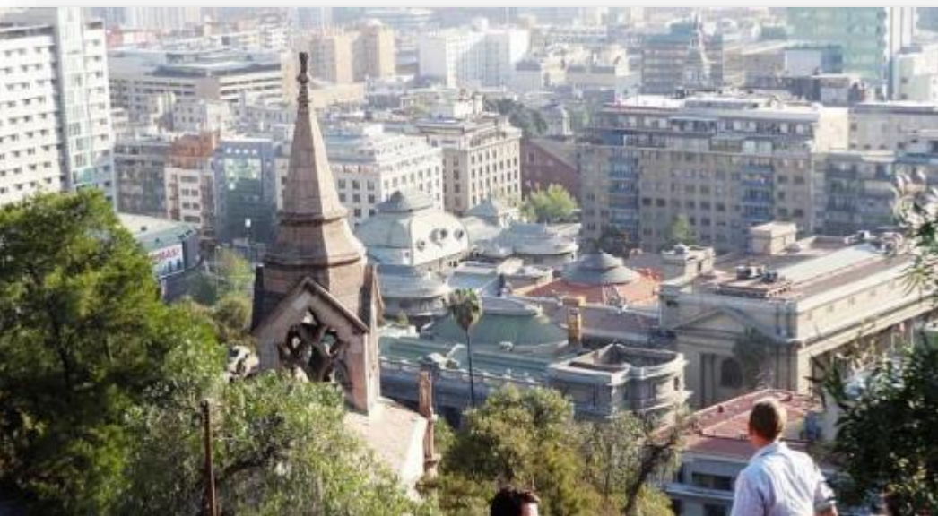
Panorama de Santiago en la actualidad

La pintura nos permite conocer nuestro pasado.