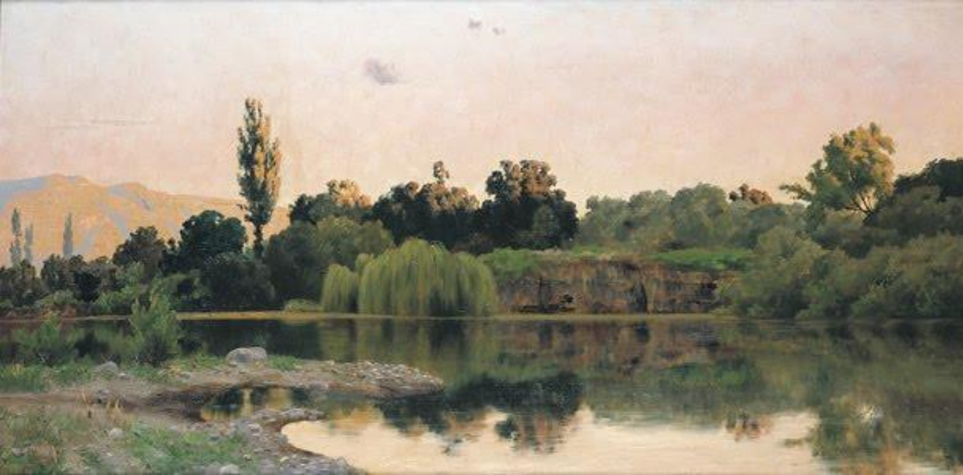
Atardecer en el estanque - Pedro Lira