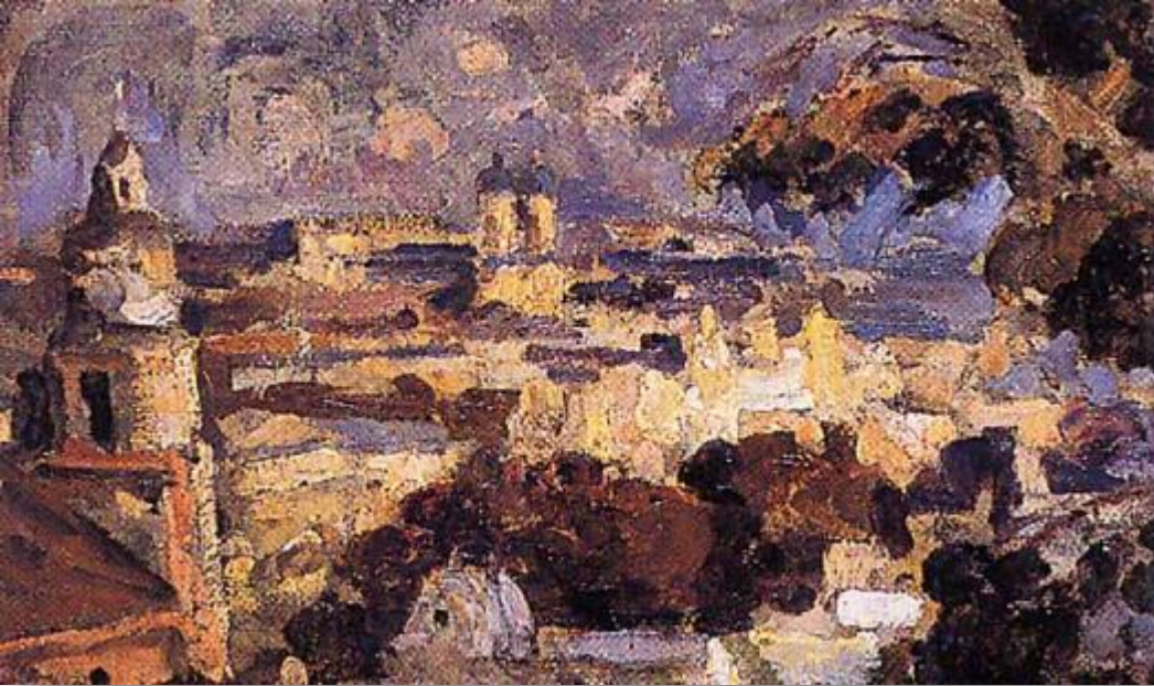
Panorama de Santiago - Juan Francisco González