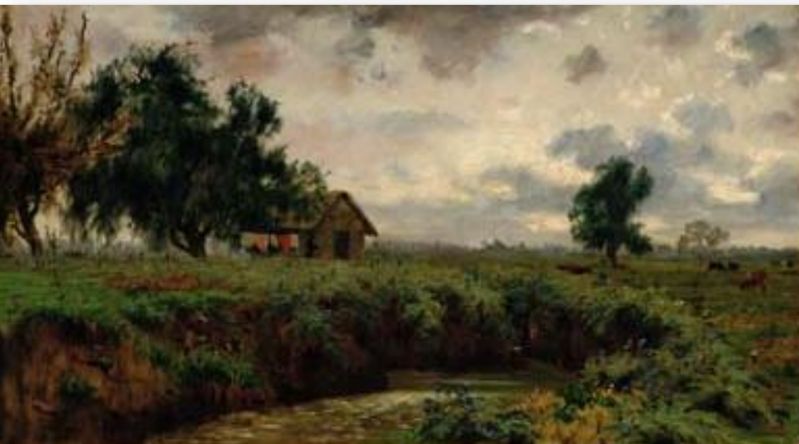
Paisaje campestre - Pedro Lira