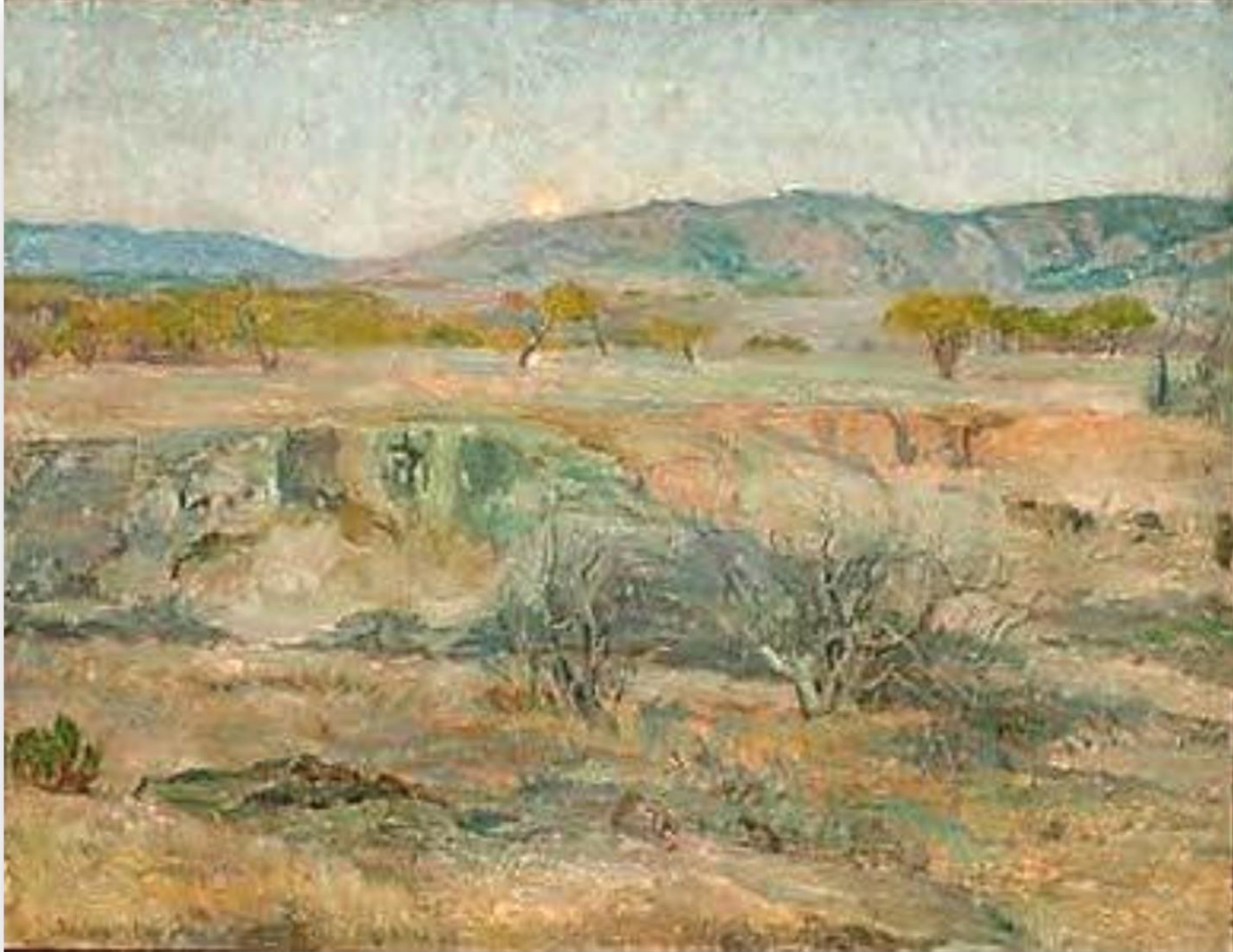
Campo agreste - Alberto Valenzuela Llanos