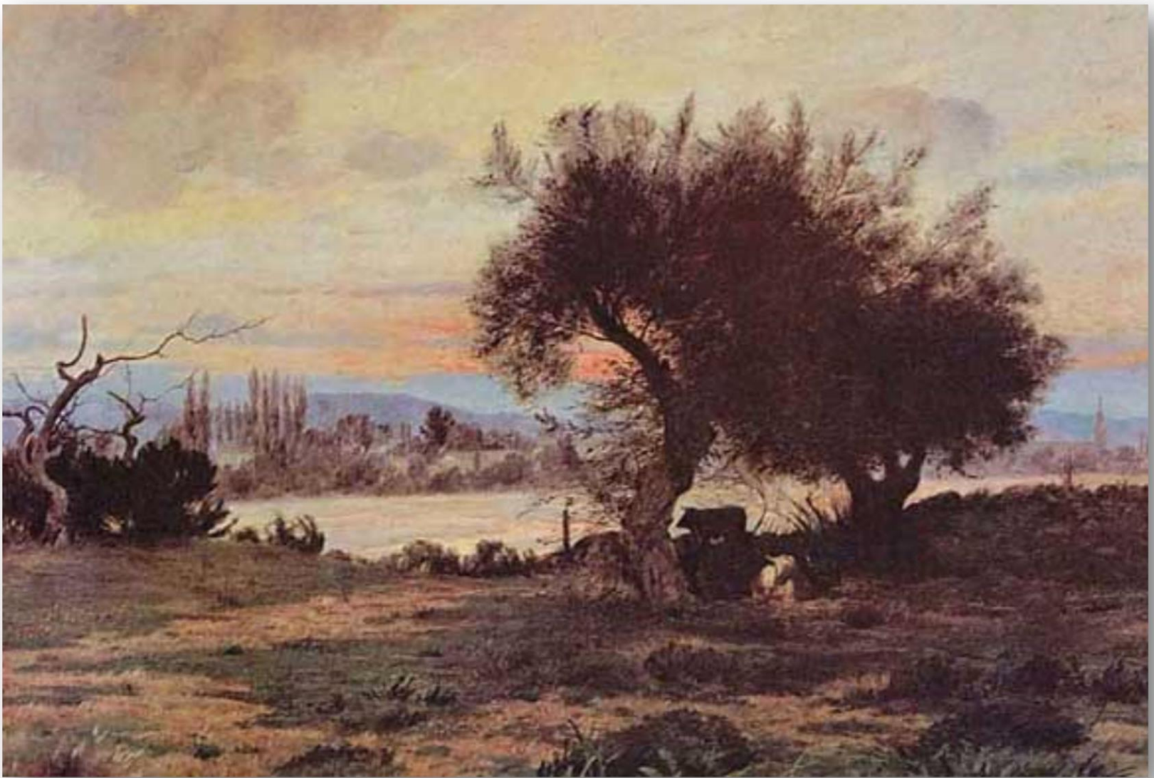
Paisaje crepuscular - Pedro Lira